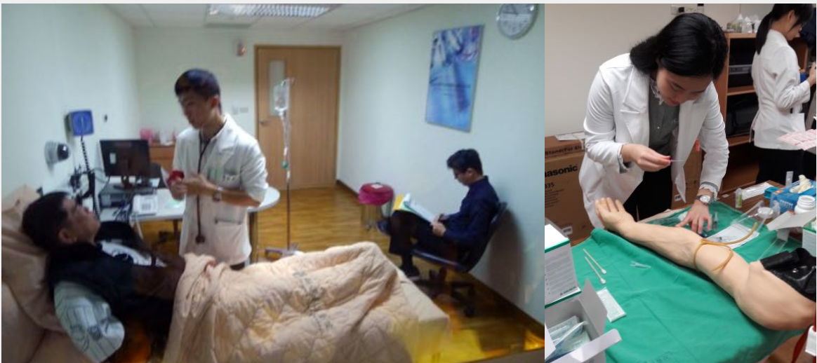
圖說：台灣OSCE考試現場於花蓮慈濟醫院