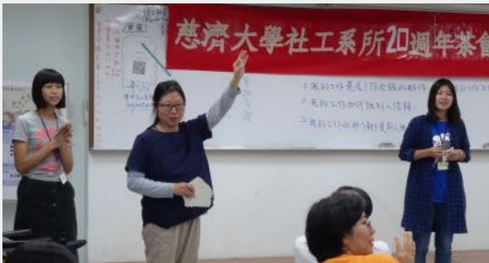
圖說： 萬育維老師是 社工系的創系 主任（左二）